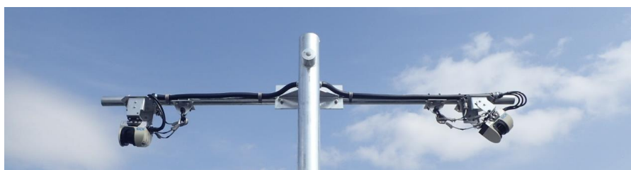
レーザ式TC計 設置例