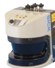
レーザセンサ 本体