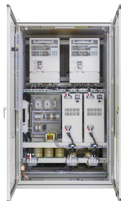
ジェットファンインバータ換気動力盤